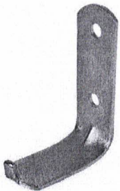
Suporte de Parede Para Extintor